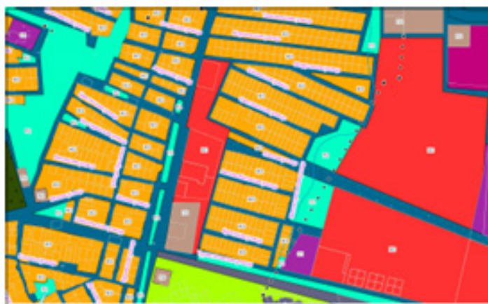
Фрагмент карты Карта функционального зонирования территории населенных пунктов городского поселения Забайкальское