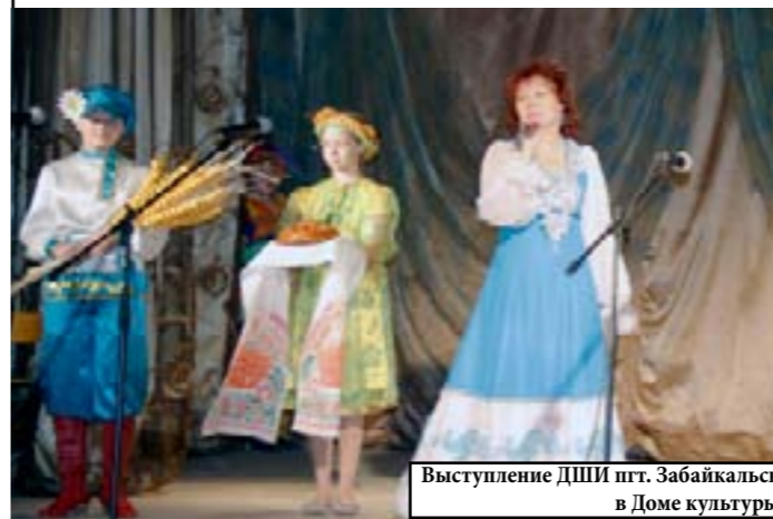
Выступление ДШИ пгт. Забайкальск в Доме культуры

Праздничный день начался с ярмарки-распродажи сельскохозяйственной продукции на Центральной площади Забайкальска. 20 торговых точек приветливо встречали забайкальцев разнообразием продукции. Свежее мясо, консервированные овощи, полуфабрикаты, свежая выпечка – все это можно было приобрести из первых рук забайкальских сельхозтоваропроизводителей.