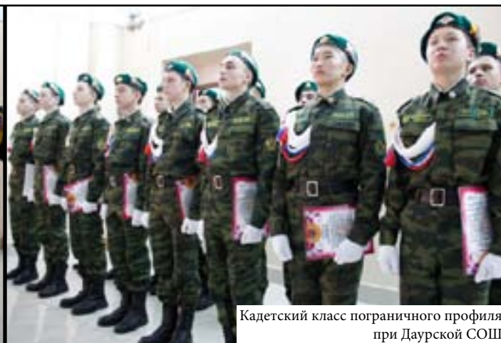
Кадетский класс пограничного профиля при Даурской СОШ