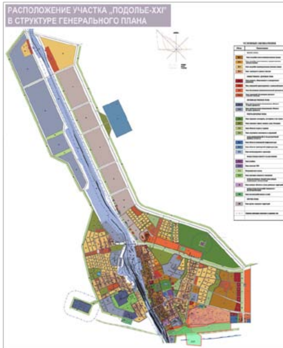
Рис.6. Расположение участка «Подолье-XXI» в структуре генерального плана.

Для входа-въезда на территорию и выхода-выезда с территории ПТК «Забайкальск» китайских граждан и входа-въезда на территорию и выхода-выезда с территории ПТК «Маньчжурия» российских граждан - организуется переход, через который предусматривается свободное перемещение российских и китайских граждан с использованием, при необходимости, легкового автотранспорта сервисного обслуживания.