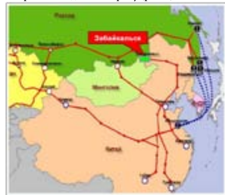
Рис. 1. Место п.г.т. Забайкальск в структуре транспортной инфраструктуры России и Китая.

Наблюдаемая активность государственных и деловых кругов Китая в приграничном районе Маньчжурия - Забайкальск объясняется ожиданием высоких дивидендов, прежде всего, от использования существующей транспортной инфраструктуры на российской территории. В частности, на сегодняшний день п.г.т. Забайкальск со своими железно - и автомобильными переходами является наиболее удобными транспортными «воротами» в Россию, дающим выход на Транссиб и далее в Европу (рис. 1)