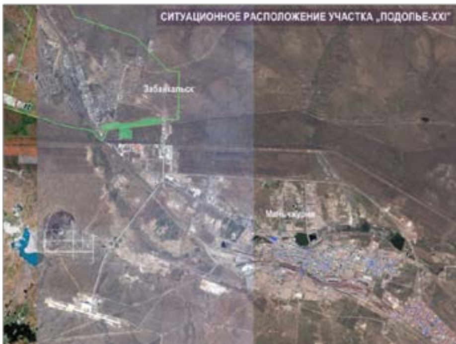
Рис.5. Ситуационное расположение участка «Подолье – XXI».

При формировании проектных предложений в концепции проекта планировки «Трансграничный туристический парк «Восточные ворота России Забайкальск-Маньчжурия»» учитывались материалы ранее разработанных градостроительных документов: генерального плана п.г.т. Забайкальск, схемы территориального развития Забайкальского района, схемы территориального планирования Забайкальского края, а также данные по динамично развиваемой сопредельной территории соседнего государства: г. Маньчжурии, Китайской Народной Республики.