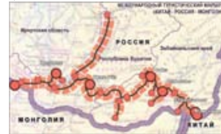
Рис. 4. Международный туристический маршрут «Китай – Россия – Монголия».

Учитывая первоначальную направленность массовых туристических потоков, а именно из Китая в Россию, главным туристическим ресурсом для всей агломерации станет бренд озера Байкал, имеющий широкую международную известность. Уже сегодня идет интенсивное строительство нескольких туристических зон, рассчитанных на 1 млн. посещений в год. Наиболее перспективным представляется маршрут Маньчжурия – Чита – Байкал – Восточные Саяны, по мере развития инфраструктуры, дополняемый турами в Монголию, предлагая, таким образом, кратковременное посещение двух стран (см. рис. 4).