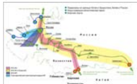
Рис. 2. Схема трансконтинентальной транспортной инфраструктуры.

Через п.г.т. Забайкальск осуществляется до 60% экспортно-импортных перевозок между Россией и Китаем, а использование железнодорожной ветки ст. Забайкальск - ст. Карымская (Транссиб) в среднем на 20-35% сокращает срок передвижения китайских грузов в Европу (рис. 2). При этом следует иметь в виду, что китайской стороной активно проработан альтернативный вариант маршрута - через казахский Достык (рис. 3).